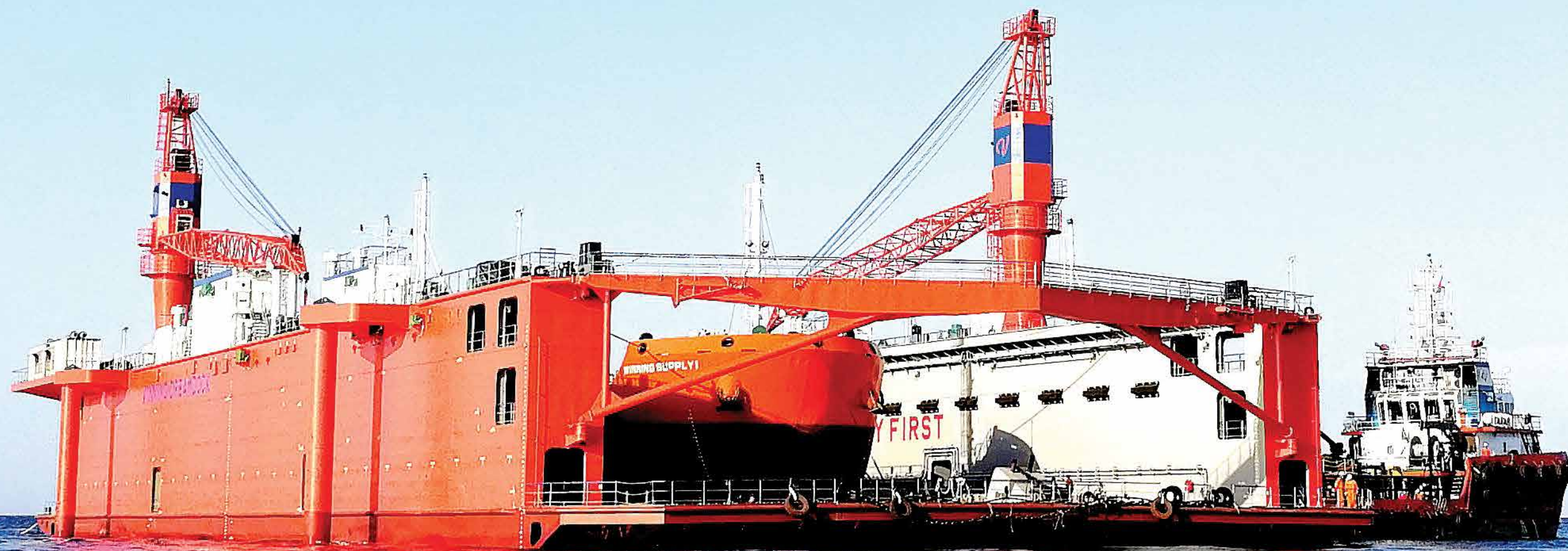
韦立非洲船厂 5000吨举力级浮船坞 Floating Dock of WASE, with a lifting capacity of 5000 tons Dock Flottant de WASE, d'une capacité de levage de 5000 tonnes

Winning Africa Shipyard et Engineer SA est une entreprise de droit guinéen et fait partie de Winning International Group. Elle est spécialisée dans la construction et la réparation de navires. En Guinée, son chantier naval est situé dans le port de Boké, terminal de Dapilon. Ce chantier naval, unique dans le pays, permet de construire et réparer tous les types de navire d'une longueur inférieure à 116 mètres. Un atelier de peinture, un centre de maintenance et un atelier à multiple usage sont prévus.