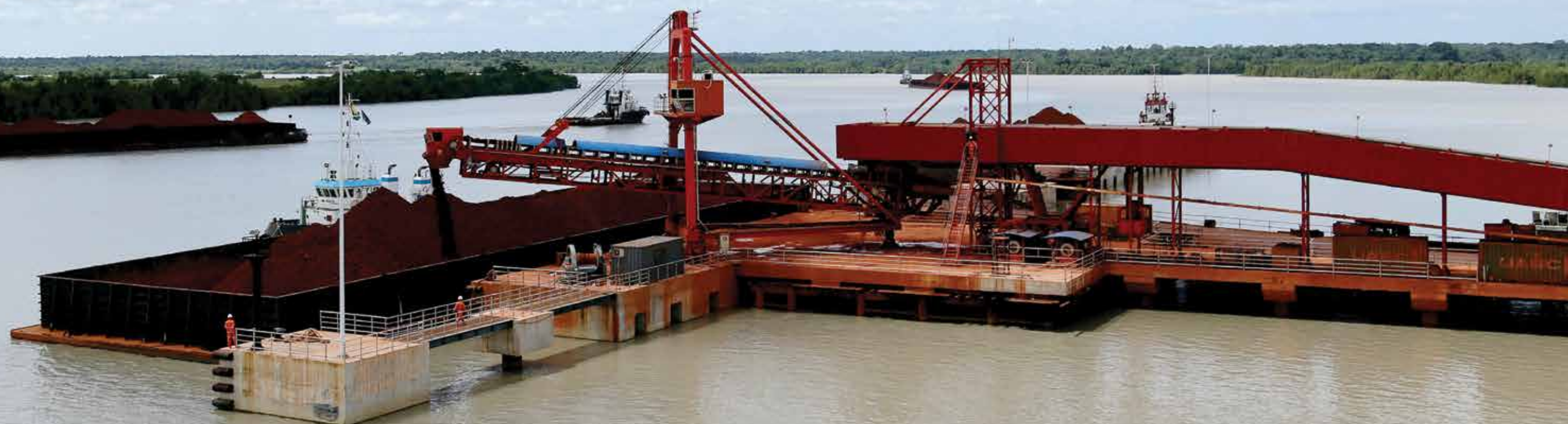
Le port de bande transporteuse à katougouma, Port de soeur de Dapilon The port of conveyor belt to katougouma, sister port of Dapilon 达必隆的姊妹港卡杜古玛港的输送带

在赢联盟的努力下,博凯河港已在国际海事组织(OMI)的全球综合船舶信息系统(GISIS)内注册。位于博凯经济特区中心,该港口朝国际港的发展与中国与非洲大陆,包括西非地区,尤其是几内亚越来越多的商业往来分不开。港口拥有40艘驳船和40艘拖轮,配备多个浮吊、一个浮动码头和好几个其它浮动设备,通过位于康姆萨的一个现代化控制中心进行调拨与分配。赢联盟建造了第一个连接新加坡、西非和中国三地的海上物流通道,为三地之间的经济与政治交流提供了便利条件。