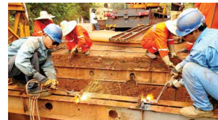
Le pont de Korrera a été reconstruit suite à un investissement de 150 000 dollars US du Consortium. The Korrera Bridge was rebuilt following an investment of $ 150,000 from the Consortium. 赢联盟斥资15万美元,为当地村民修缮KORERRA大桥。