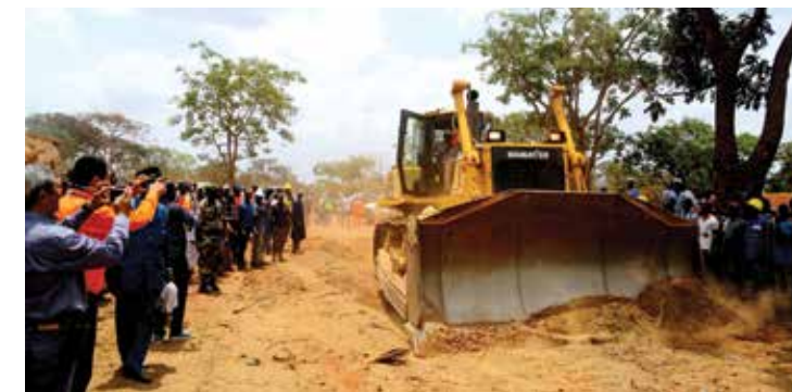
Le Consortium SMB-Winning a aussi aménagé plusieurs routes communautaires en investissant 10 millions de dollars US. The SMB-Winning Consortium has also developed several community roads by investing US $ 10 million. 赢联盟投资1000万美元,翻新了数条社区道路。

2018年11月,连接博凯大区与卡杜古玛港的“和谐大道”和位于康姆萨的一个崭新的控制中心正式剪彩。全线硬化的“和谐大道”长16.5公里,项目投资700万美元,也使就近的第3号国道约10公里路段得以翻新,成为当地一条名副其实的生命线,将位于博凯城区周边的数个村庄紧紧相连,与城区融为一体,造福于民。