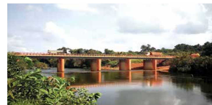
Le pont de Natampou, d'une longueur de 150 mètres, est une structure entièrement construite par le Consortium dans le cadre de l'aménagement de sa route minière. Il permet le désenclavement de toute la zone située à l'Est de la rivière Natampou, et le déplacement des populations vers de nouvelles zones d'activités économiques. The 150 meter long Natampou Bridge is a structure entirely built by the Consortium as part of the development of its mining road. It allows the opening of the entire area east of the Natampou River, and the displacement of population to new areas of economic activities. 南塔姆普桥长150米,由赢联盟全新建造,是矿区道路项目的组成部分。该桥将南塔姆普东岸与其它地区连为一体,使当地居民得以搬迁至新的经济发展区。